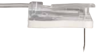
GRIPPER PLUS® Sicherheits-Portpunktionsnadeln mit Huberschliff