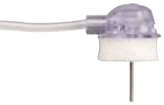
GRIPPER® Micro Sicherheits-Portpunktionsnadeln mit stumpfer Kanüle