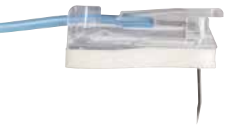
GRIPPER PLUS® POWER P.A.C. Sicherheits-Portpunktionsnadeln mit Huberschiff