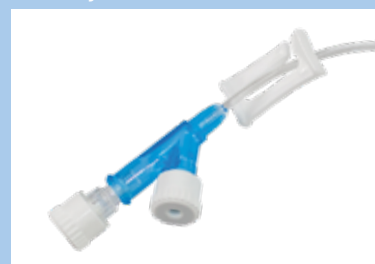
Dubbel port med luerfattning