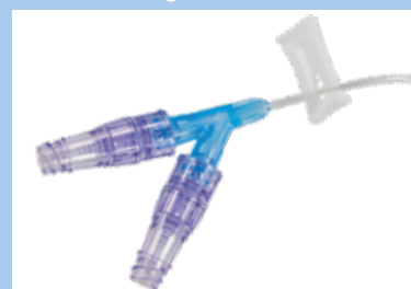
Dubbel port med dubbla injektionsmembran