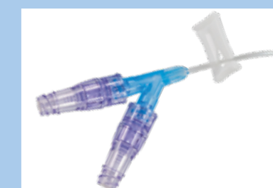
Duas portas com conectores sem agulha