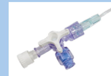
Porta única com torneira de 3 vias e conector sem agulha