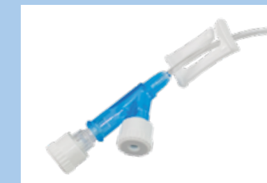
Porta doppia con doppi tappi terminali