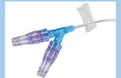
Dualport mit zwei nadelfreien Konnektoren