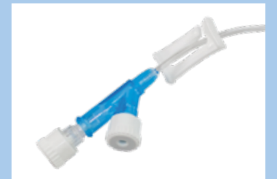
Dualport mit zwei Endkappen