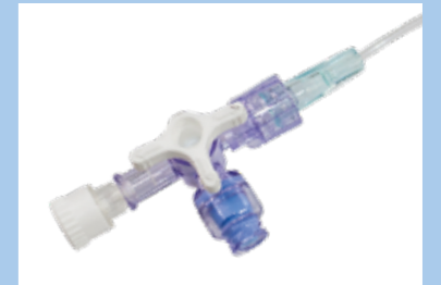
Einzelport mit Absperrhahn und nadelfreiem Konnektor