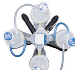
2連 + 2連